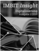
Yannic Fleck Protiviti